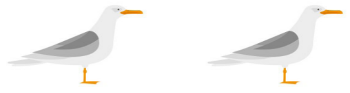
La nouvelle campagne sur le suivi environnemental des dragages a été installée fin septembre 2020.

20 poches d'une contenance de 100 moules chacune ont été installées sur les bouchots sur les 2 points de suivis dans l'estuaire, à Kervoyal et au Halguen. L'objectif est d'évaluer, comme chaque année, l'impact éventuel des dragages en suivant la mortalité et la croissance des moules sur un cycle complet. Le prochain relevé aura lieu en décembre.