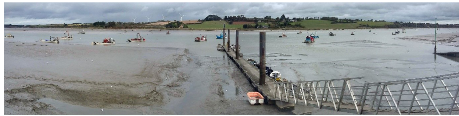
Les dragages en aval du barrage d'Arzal étaient à l'arrêt depuis le 15 janvier 2020. Ils ont repris depuis le 14 août pour la saison hivernale.